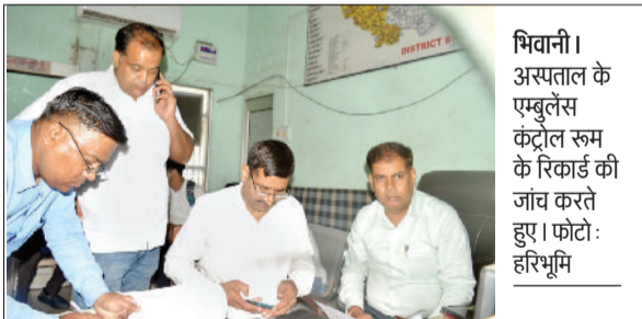
भिवानी। अस्पताल के एंबुलेंस कंट्रोल रूम के रिकॉर्ड की जांच करते हुए।

सामान्य अस्पताल के एंबुलेंस कंट्रोल रूम में सीएम फ्लाइटिंग ने मारा छापा। आज सीएम फ्लाइटिंग की टीम ने सामान्य अस्पताल के एंबुलेंस कंट्रोल रूम में छापारा मारा और इस मामले में सीएम फ्लाइटिंग की और से