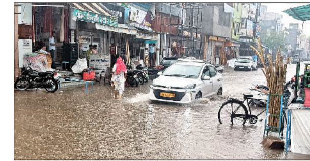
लोहारू। बारिश के बाद सड़कों पर जमा पानी का दृश्य।