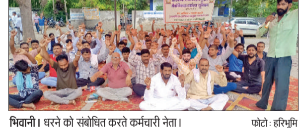
भिवानी। धरने को संबोधित करते कर्मचारी नेता।