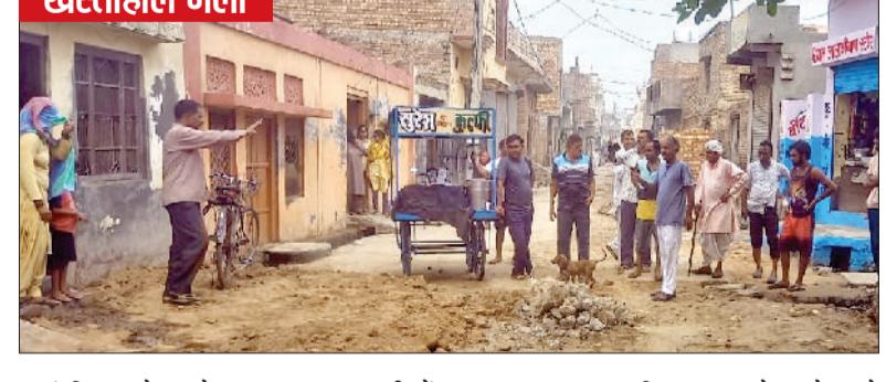
कहा कि सुनते-सुनते कान पक गए, गली में विकास के नाम पर आज तक ईंट नहीं लगी है। यही हालात हमारे सामुदायिक केन्द्र, अम्बेडकर पार्क, शमशाना घाट, धर्मशाला, गली व चोकों की है। वर्ष 2017-18 में कस्बा के सभी शमशान घाट, धर्मशाला, पार्क जाति व वर्ग को पांच-पांच लाख रुपये दिये थे। हमारे हिस्से का एक भी पैसा विकास के नाम पर नहीं लग पाया।