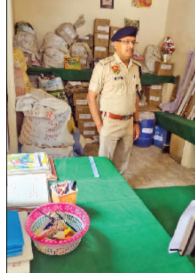
भिवानी। थाने का निरीक्षण करते एसपी।

पुलिस अधीक्षक ने थाना प्रबंधक को थाने का रिकॉर्ड सुरक्षित रखने, थाना परिसर में साफ सफाई रखने के निर्देश दिए और पुलिस कब्जे में लिए गए वाहनों के मामलों का जल्द से जल्द निपटारा करने के निर्देश दे कहा कि थाना में कोई भी कार्य लंबित नहीं रहना चाहिए। सभी कार्य समय अवधि में पूरे किए जाए। थाने में पुलिस जवानों के रहन-सहन