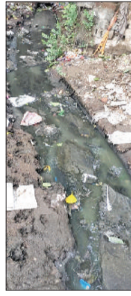
पब्लिक हेल्थ व नगर परिषद के अधिकारियों को निर्देश दिए कि बरसात के दौरान शहर में कहीं पर भी जलभराव की स्थिति उत्पन्न नहीं होनी चाहिए। उन्होंने निर्देश दिए कि सभी एसटीपी सुचारू रूप