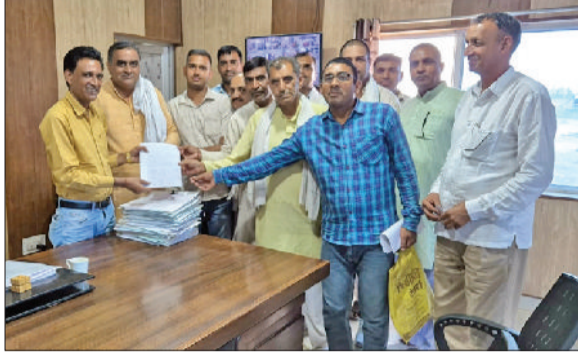
चरखी दादरी। विभाग के कार्यकारी अभियंता कार्यालय के समक्ष धरने के दौरान नरिबाजी करते जनस्वास्थ्य अभियांत्रिक विभाग के ठेकेदार व अधिकारी को ज्ञापन सौंपते जनस्वास्थ्य अभियांत्रिक विभाग के ठेकेदार।