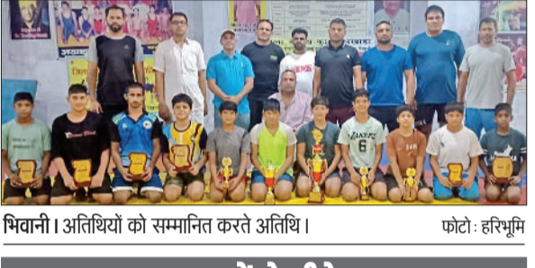
भिवानी। अतिथियों को सम्मानित करते अतिथि।