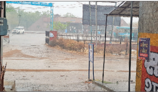
बाद आसमान में घने बादल छाए और बारिश शुरू हुई। करीब 40 मिनट तक हुई इस बारिश ने उमस व गर्मी से लोगों को राहत दिलाई और मौसम सुहाना होने से लोगों को सुकून मिला। वहीं भीषण गर्मी से मुरझा रही कपास, ज्वार, सब्जी आदि की फसलों में भी बारिश से काफी

बाढ़ड़ा क्षेत्र में लंबे इंतजार के बाद वीरवार को दोपहर बाद बारिश हुई है। जिससे लोगों को गर्मी व उमस से राहत मिली है। वहीं बारिश से फसलों में भी लाभ होगा। बारिश के बाद मौसम सुहाना होने से लोगों ने राहत की सांस ली है। बता दें कि बीते कई दिनों से क्षेत्र के लोग भीषण गर्मी की मार झेल रहे थे। पहले जहां लू के थपेड़ों ने लोगों को जमकर परेशान किया तो इस सप्ताह उमस भरी गर्मी लोगों को परेशान कर रही थी। लोग गर्मी से राहत पाने के लिए बारिश के इंतजार कर रहे थे। वीरवार को मौसम में सुबह से ही परिवर्तन देखने को मिला और आसमान बादल छाने के साथ तेज पुरवाई हवा चल रही थी। दोपहर