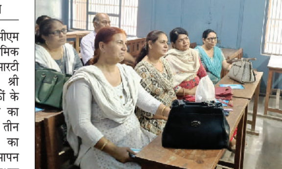
बवानीखेड़ा। वीर शहीद गुलाब सिंह पीएम श्री राजकीय कन्या वरिष्ठ माध्यमिक विद्यालय में एएससीआईटी गुरुग्राम पीएम श्री विद्यालयों के शिक्षकों का प्रशिक्षण में संबोधित करते हुए।