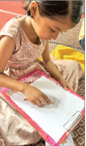
भिवानी। प्रतियोगिता में भाग लेती एक प्रतिभागी।