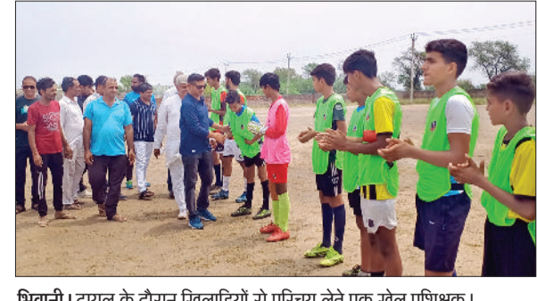
भिवानी। ट्रायल के दौरान खिलाड़ियों से परिचय लेते एक खेल प्रशिक्षक।

प्रशस्ति पत्रों का वितरण किया। इसके साथ ही समस्त नागरिकों को भरोसा दिलाया कि क्षेत्र में अगर किसी जरूरतमंद होनाहार विद्यार्थी को किसी भी प्रकार के सहयोग की आवश्यकता हो तो उनसे निरसंकोच मिल सकता है।