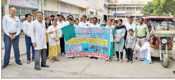
भिवानी। जागरूकता रैली को झंडी दिखाकर रवाना करते हुए।