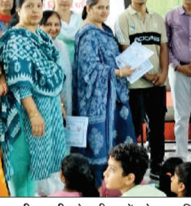
चरखी दादरी। मेधावी बच्चों को सम्मानित करते अतिथि।